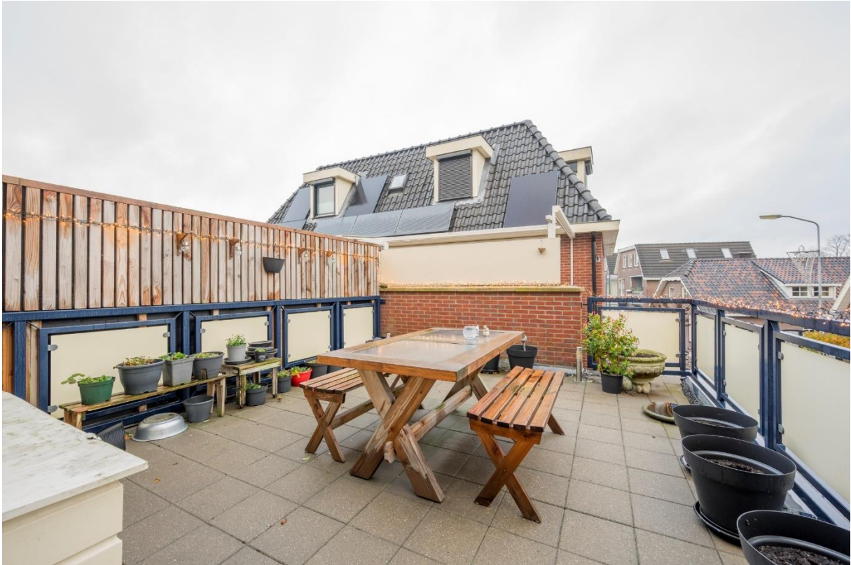
Terras, toegangsdeur in keuken